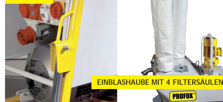
EINBLASHAUBE MIT 4 FILTERSÄULEN